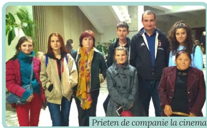
Prieten de companie la cinema

Din 2020, vom începe implementarea proiectului în raionul Criuleni. Voluntarii identificați vor fi instruiți și ghidați pentru a oferi servicii și a-i însoți în diverse activități de socializare și timp liber pe tinerii și adulții cu dizabilități.