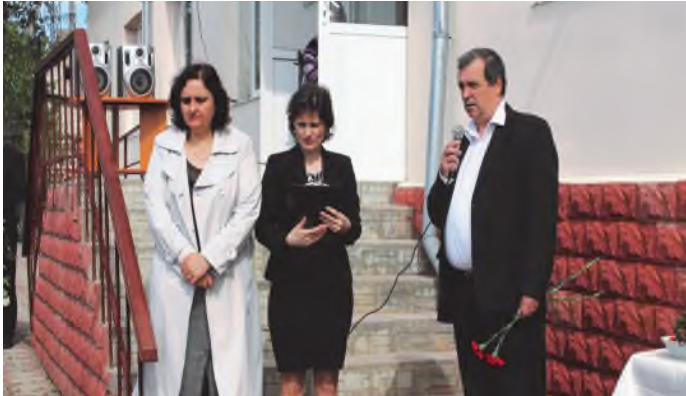
secretarul Consiliului raional Criuleni, membru al consiliului de administrare al