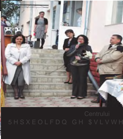
Centrul 5HSXEOLFDO GH $VLVWHQ 3VLKRSHGDI